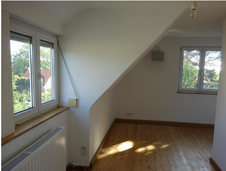
4. Zi. Obergeschoss