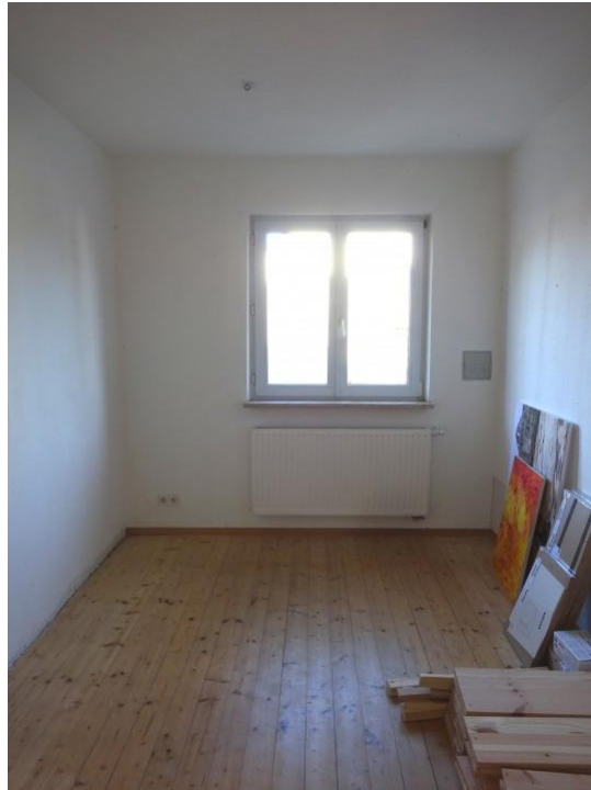
3. Zi. Untergeschoss