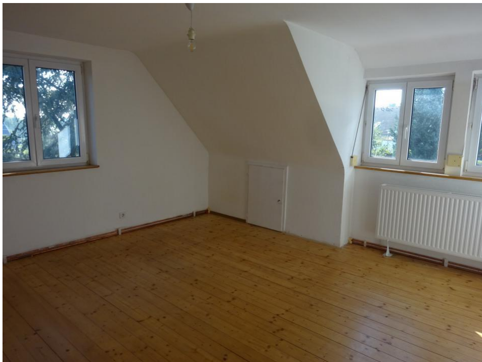
1. Zi. Obergeschoss