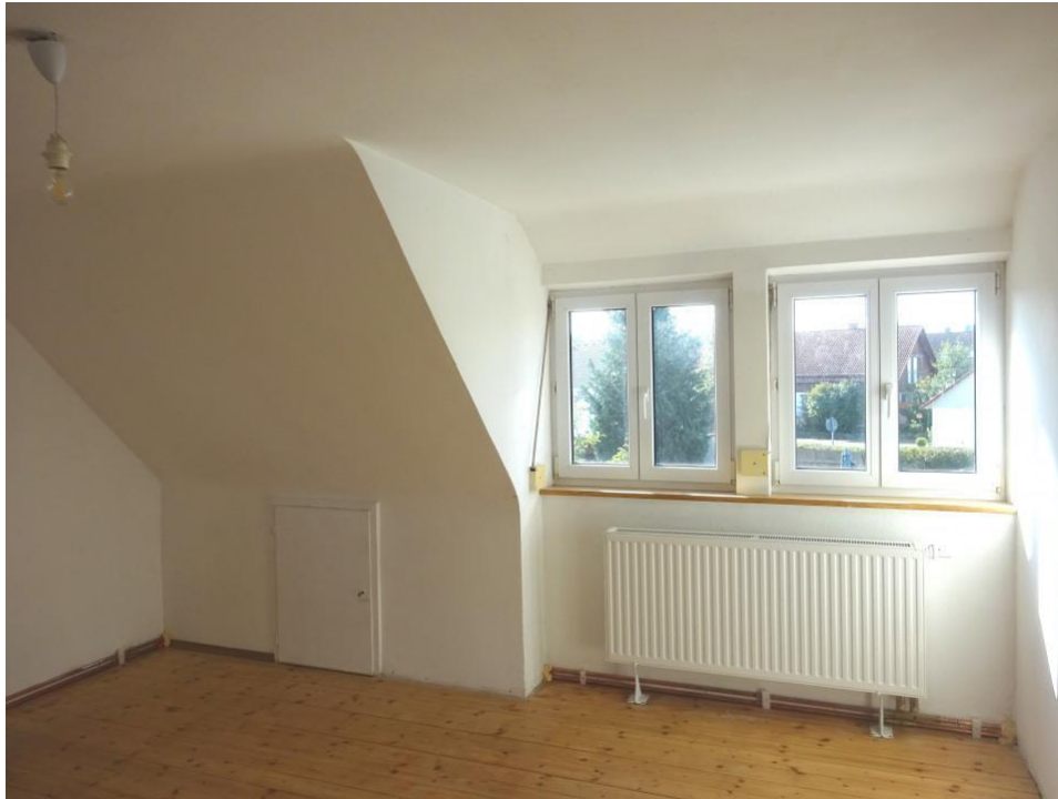
1. Zi. Obergeschoss