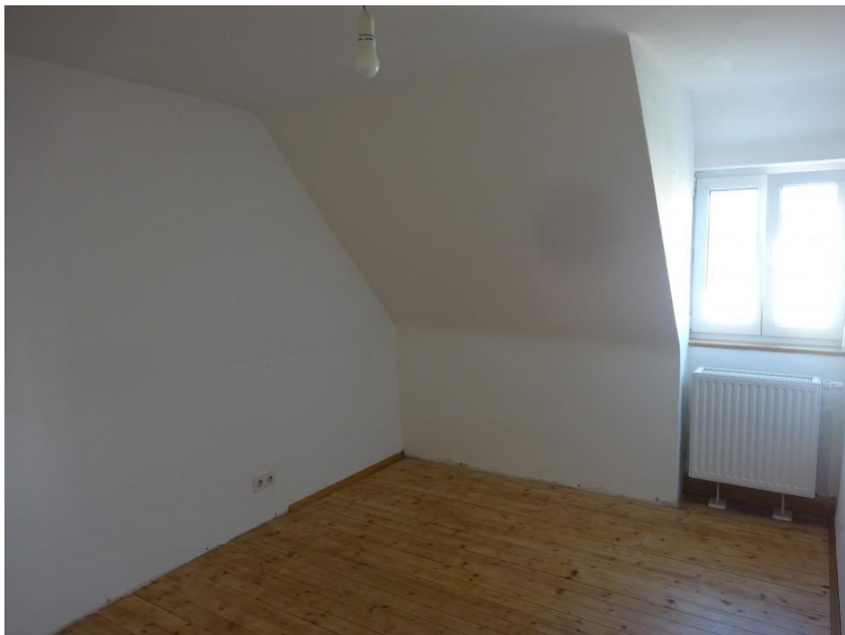
3. Zi. Obergeschoss