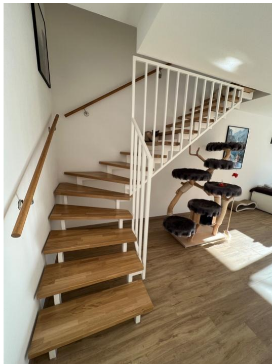
Treppe in Dachgeschoss