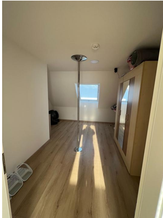
Zimmer 2 Dachgeschoss