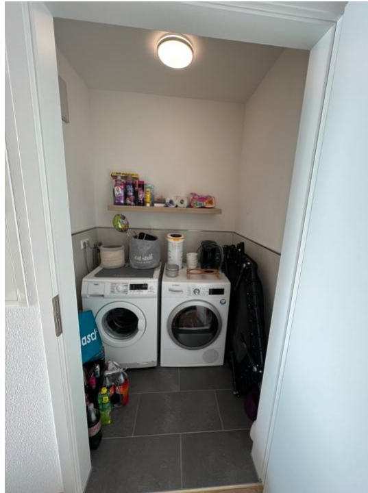
Abstellraum mit Waschmaschinenanschluss