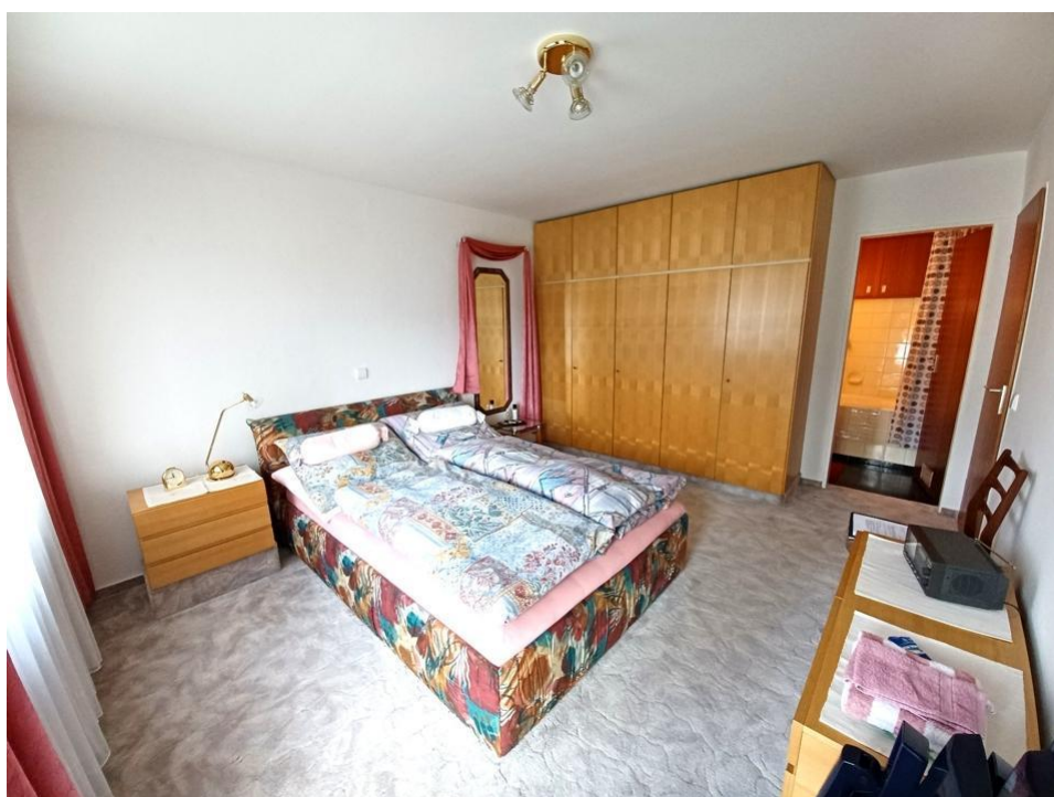
Schlafzimmer mit Zugang Badezimmer