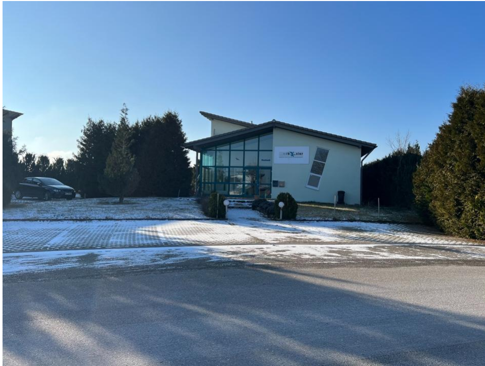
Außen Ansicht mit Stellplätzen