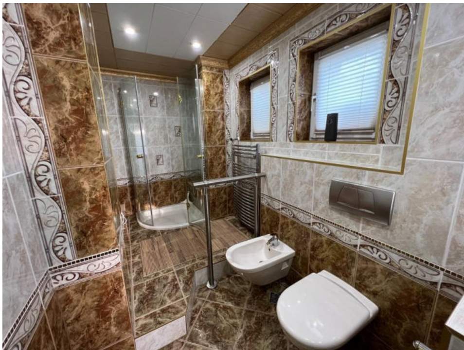
Badezimmer 1 OG