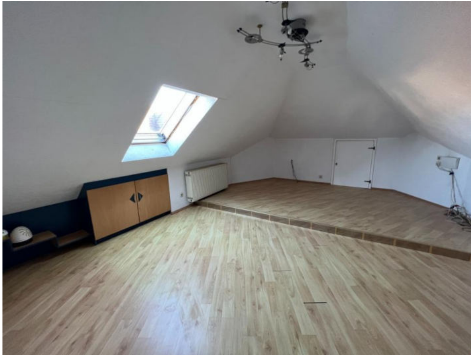
Zimmer 2 DG