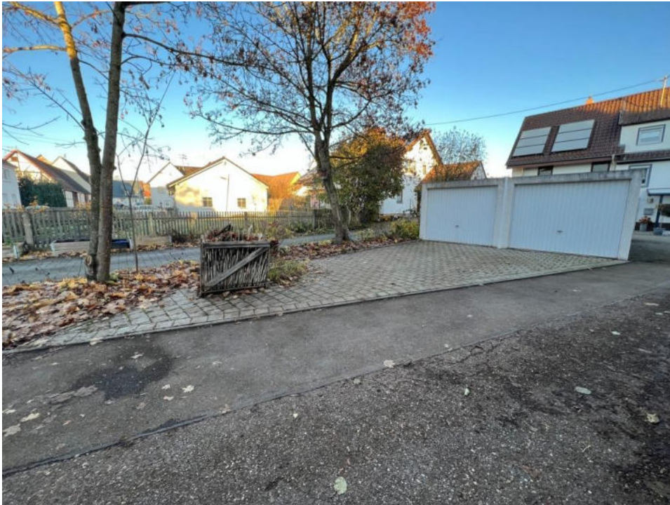
Garagen mit Stellplatz