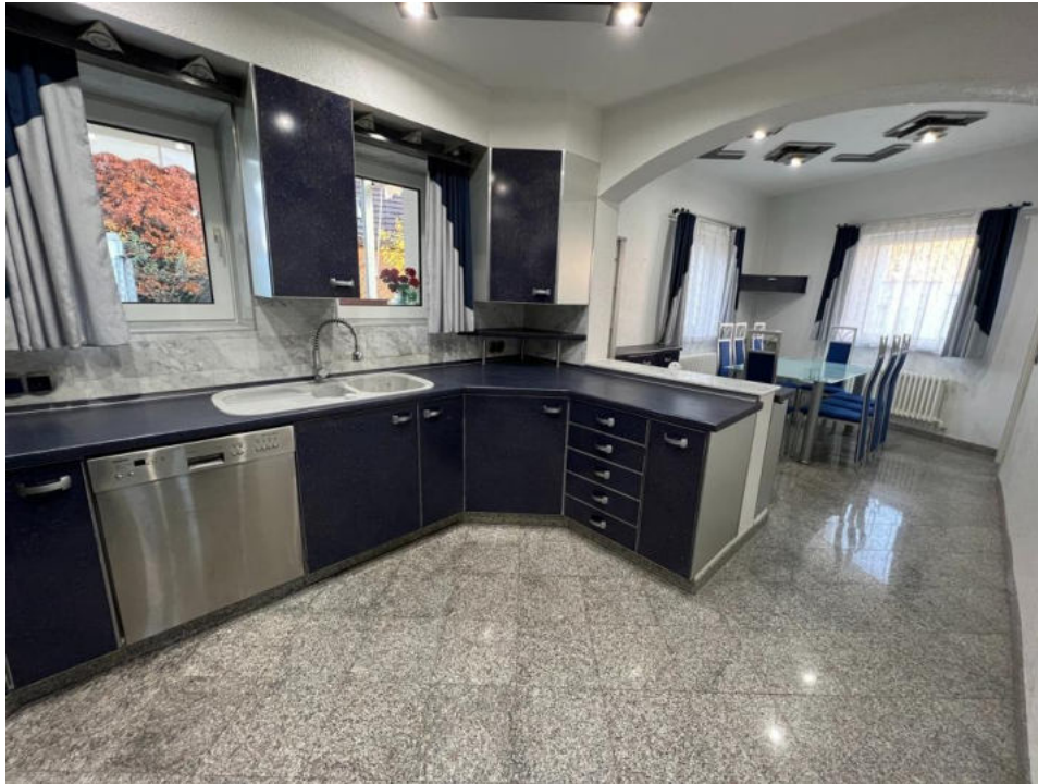
Küche mit Esszimmer EG