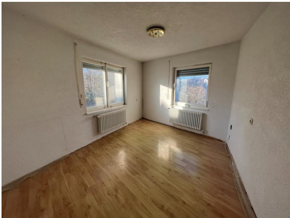
Zimmer 4 OG