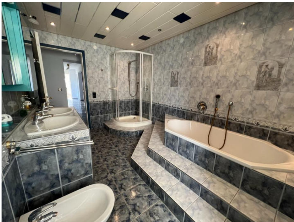
Badezimmer 2 OG