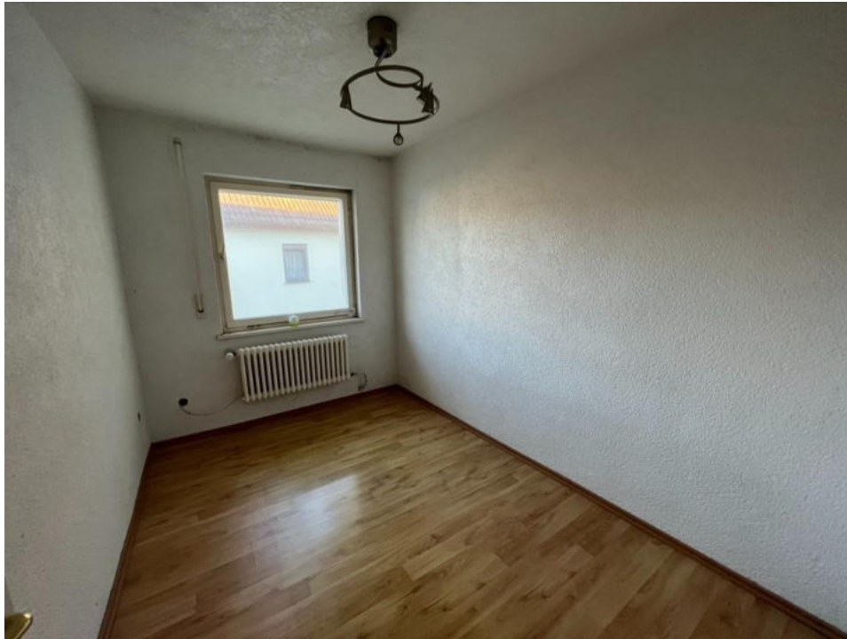
Zimmer 3 OG