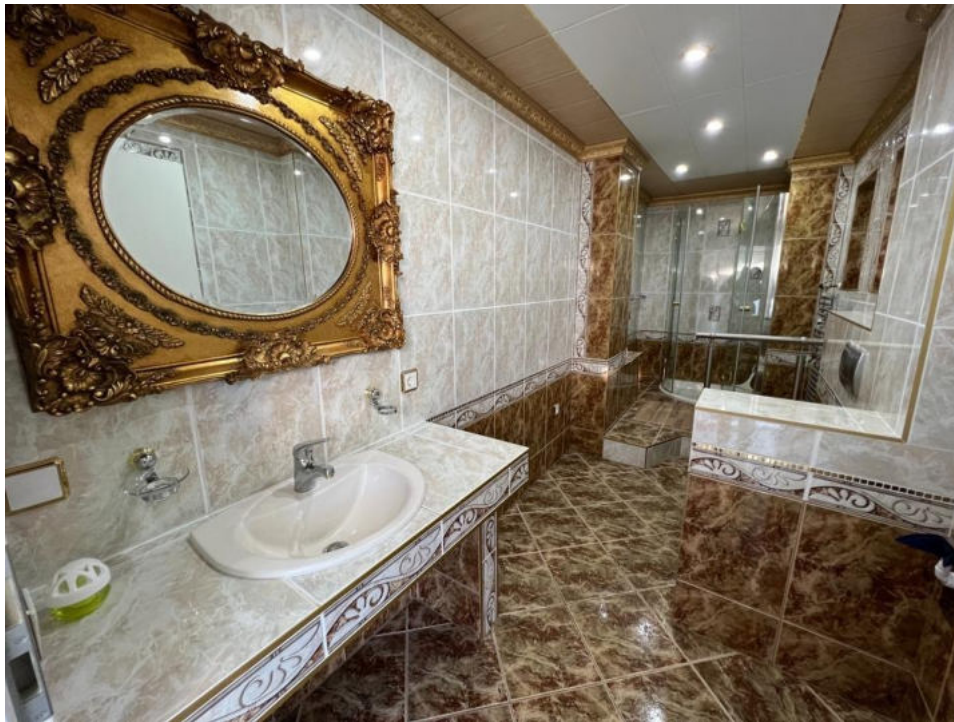
Badezimmer 1 OG