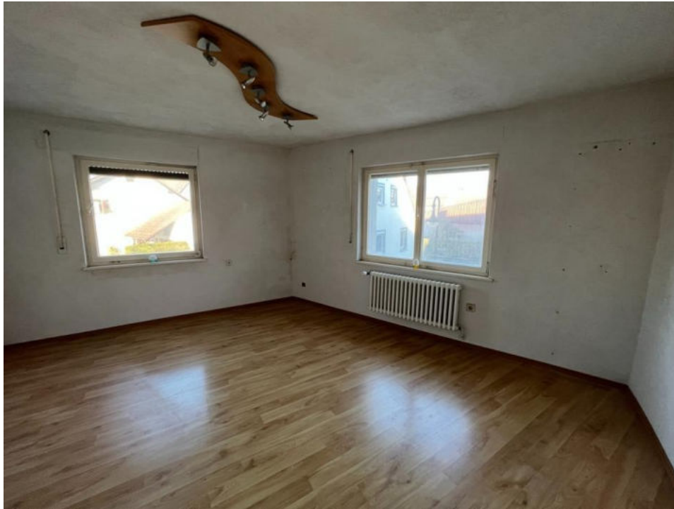
Zimmer 5 OG