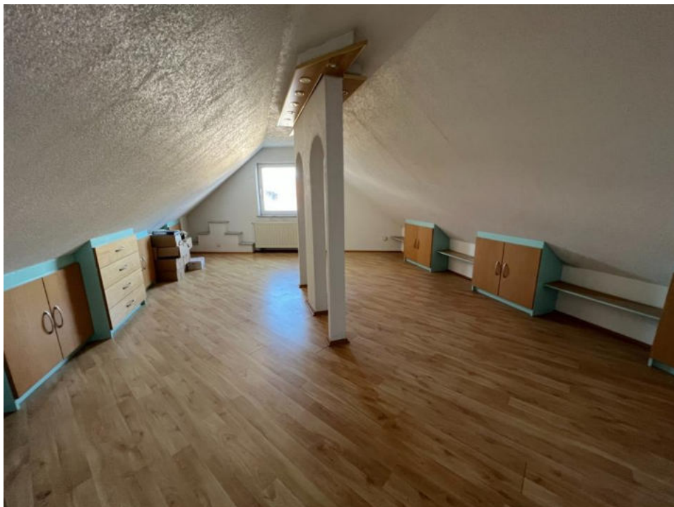
Zimmer 1 DG