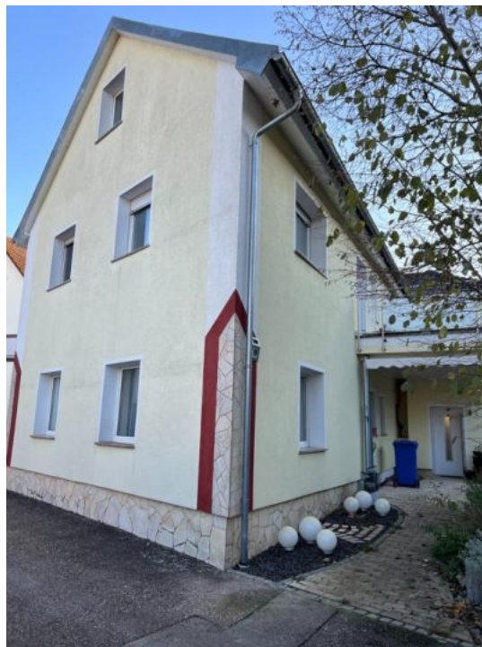
Hausansicht mit Hintereingang