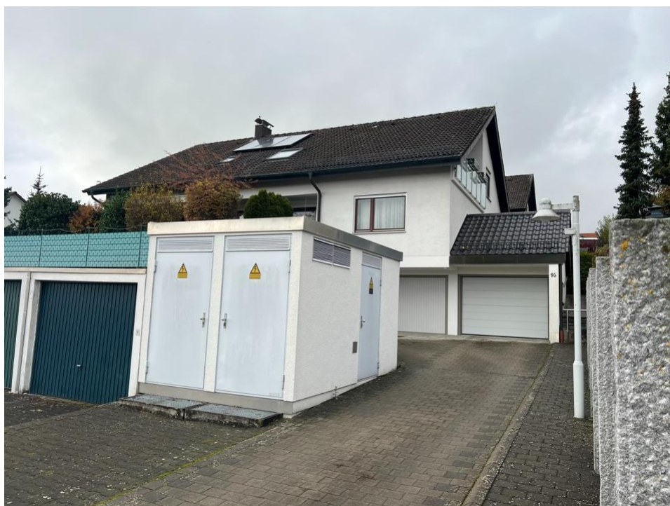
Hausansicht mit Garagenzufahrt