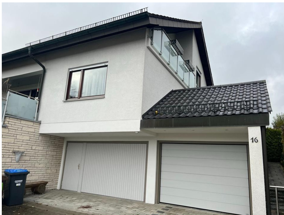
Hausansicht mit Garage