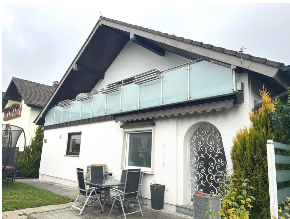
Hausansicht mit Freisitz