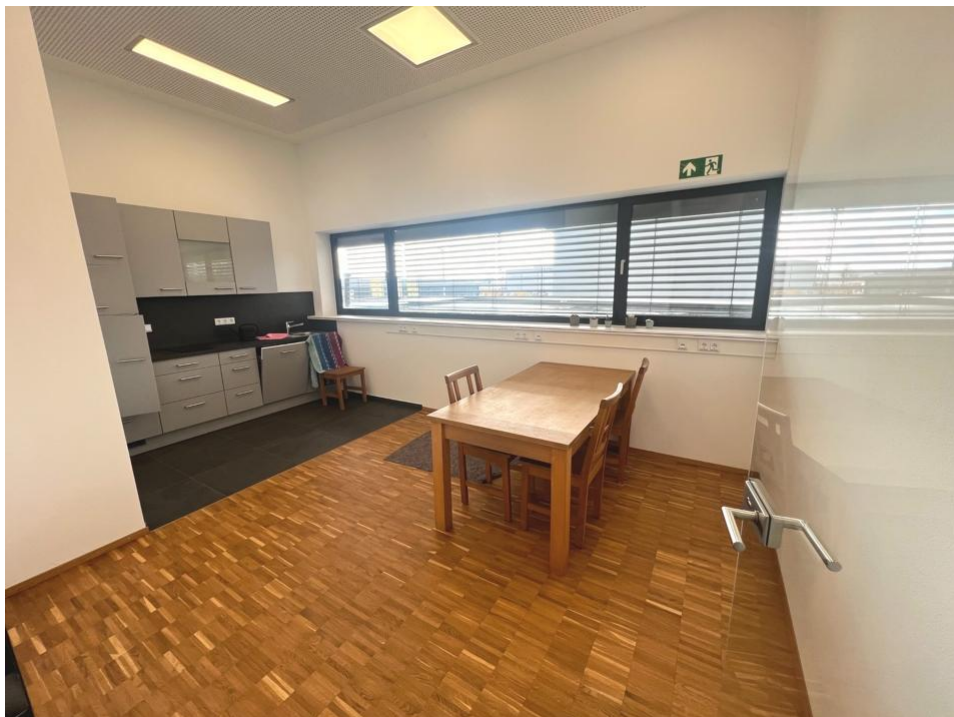
Büroraum 3 mit Küchenzeile